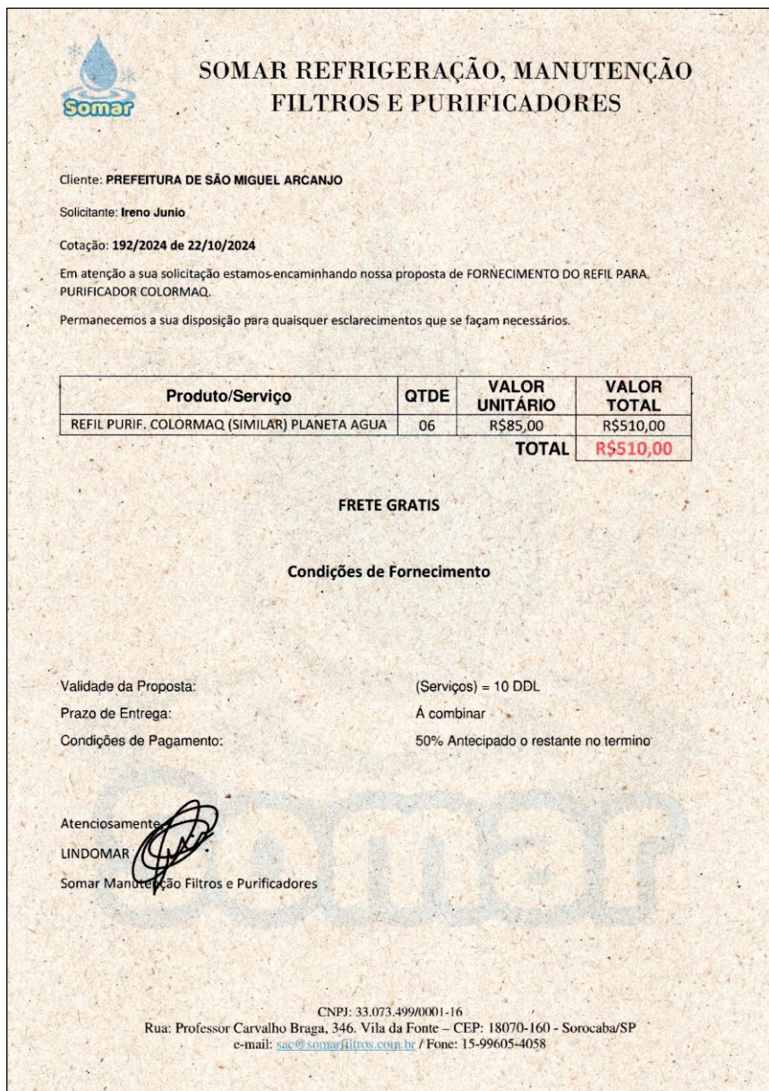
Figura 2 Orçamento Somar

Prédio "Casa de Leis Vereador José Ramos"